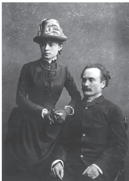
Ольга Хорунжинська та Іван Франко. Шлюбне фото. 1886 р.

Для Ольги - можливістю побачити Європу, до якої зі Львова було ближче, як із Києва. Зрештою, як писала Антоніна Трегубова: «Вона покляла в основу свого життя дати йому [Франку] оточення, сім'ю, де б він знаходив і фізичний, і моральний спокій; з дітей своїх вибрала йому помічників, робітників та бесідників». У Львові Ольга одразу залучається до громадського життя. Вона знайомиться із лідеркою руху феміністок на Галичині Наталею Кобринською, пише для жіночого альманаху «Перший вінок» розвідку «Карпатські бойки і їх родинне життя». Частина посагу теж пішла на громадські справи. На них видавався заснований Франком журнал «Життя і слово», вийшли збірка «З вершин і ни-